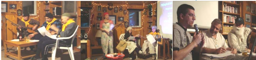
Momentos estelares del festival de tríos en la BCAA

El catering fue provisto por el Restorán Mafalda y las bebidas, por Almacenes Jade. La asistencia médica fue brindada por Emergencia Nana.