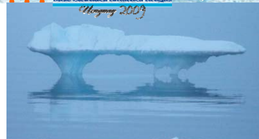
Primer Premio Categoría 1, Ganadora: NANA (Uruguay)